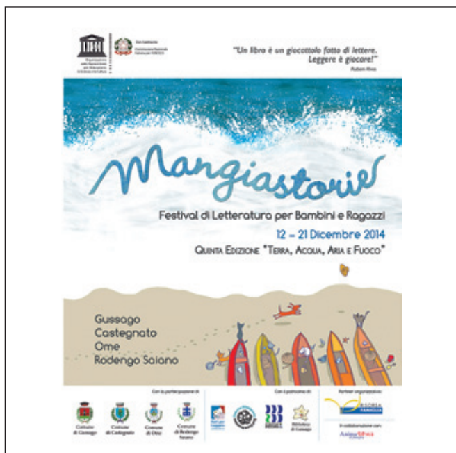
Fig. 2 - La locandina del Festival.