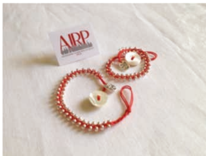
Fig. 1 - Il braccialetto rosso AIRP.

La manifestazione è promossa dalla Società Internazionale di Nefrologia e dalla PKD Foundation per promuovere la consapevolezza sul tema (Fig. 2).