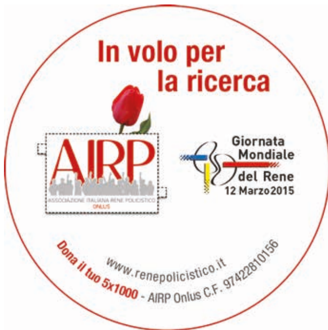
Fig. 3 - AIRP in volo per la ricerca nella Giornata mondiale del Rene.

L'importanza della prevenzione è legata alla circostanza che le patologie renali hanno una sintomatologia molto tardiva e, quando il paziente avverte i disturbi, nella maggior parte dei casi la funzionalità renale è già compromessa. Lo scopo di questa iniziativa è perciò quello di accrescere la consapevolezza che è possibile contrastare la malattia renale, se questa viene diagnosticata precocemente. Un adeguato trattamento delle cause permette infatti di ritardare complicazioni legate al deterioramento dei reni.