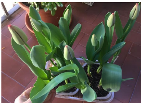
Figura 1. "I miei tulipani rossi"

Questi sono i miei, e ne vado molto fiera!