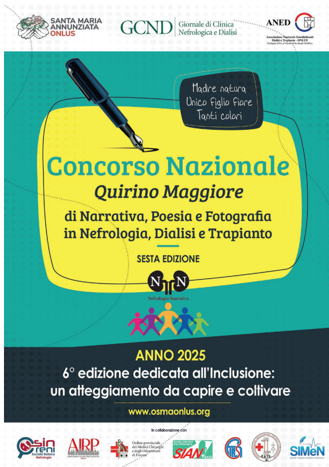
FIGURA 2 - Locandina della 6ª edizione 2025 del Concorso di Narrativa Q. Maggiore.